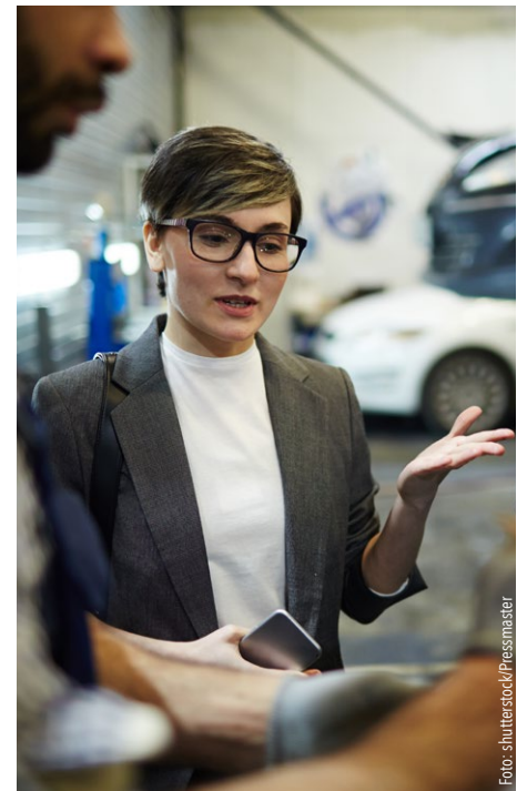
Sporadisch auftretende Fehler verlieren mit Fehlerumgebungsdaten ihre Schrecken.